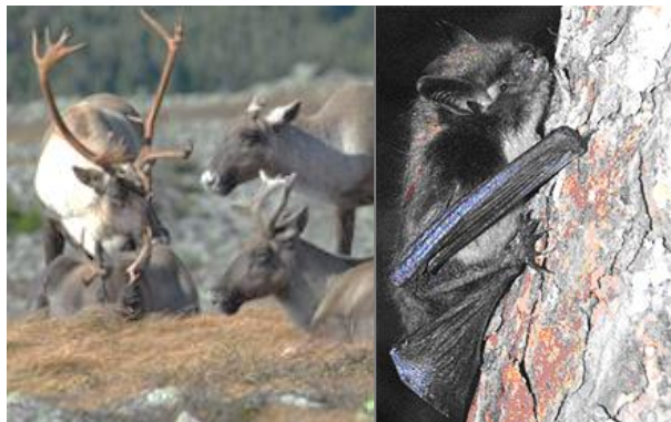
Caribou des bois montagnard, population de la Gaspésie; Petite chauve-souris brune