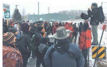
Marche pour le climat (Cacouna)