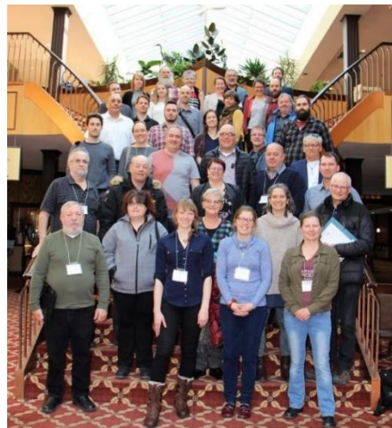
Consultation sur la gestion des PAEE