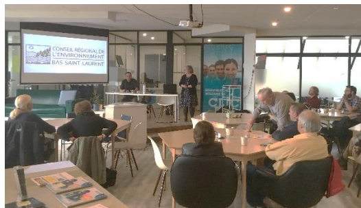
A.G.A. du CREBSL. 7 juin 2018