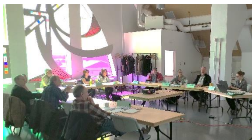
Rencontre de la Table régionale PNPÉ, 2 mai 2019