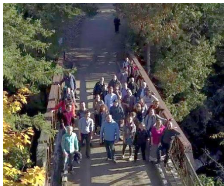
Formation des chargés de projet des CRE