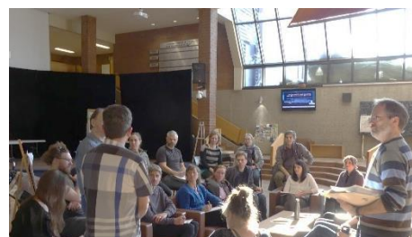
Pour un Rimouski carboneutre