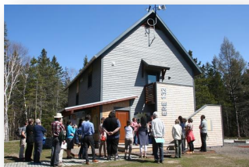
Visite de la maison ERE132 lors de l'AGA 2016