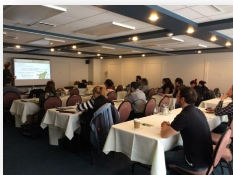
Atelier de diffusion des études en milieu agricole, mars 2017

• Atelier de diffusion : organisation et réalisation d'un atelier sur les études et outils géomatiques sur la qualité de l'eau et la biodiversité ainsi que deux études sur les sols (MAPAQ) (février-mars)