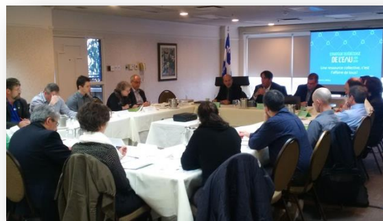
Consultation sur la mise à jour de la politique de l'eau, mai 2016