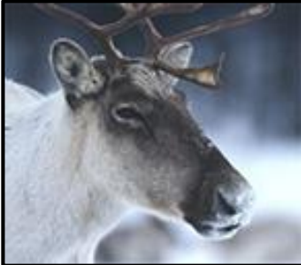
Caribou forestier.

Le CREBSL et son regroupement (RNCREQ) sont très satisfaits de l'intention gouvernementale de créer une grande aire protégée dédiée à la protection des meilleurs habitats connus pour le caribou forestier au Québec, annoncée le 28 novembre.