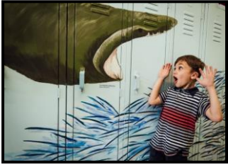
Projet «Saint-Laurent : mon école, mon fleuve».

Le Prix Action David Suzuki est un concours de projets écologiques destiné aux citoyens et organismes. Parmi plus de 160 projets soumis, le projet « Saint-Laurent : mon école, mon fleuve » de l'école Du-Grand-Pavois-Sainte-Agnès de Rimouski termine parmi les 10 finalistes.