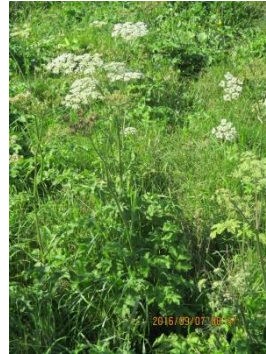
Berce sphondyle

Par l'intermédiaire de son site Web, la municipalité de Rivière-Ouelle offre de l'information sur la stratégie québécoise d'économie d'eau potable et sur ses efforts en ce sens. | Pour en savoir plus |