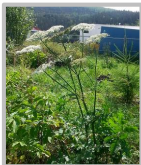
Berce commune.

Les partenaires du projet, dont le CREBSL, célébraient le 5 juin dernier l'inauguration du parc éolien Nicolas-Riou . | Voir la vidéo inaugurale | Lire le communiqué |