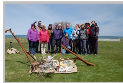
Nettoyage de berges.