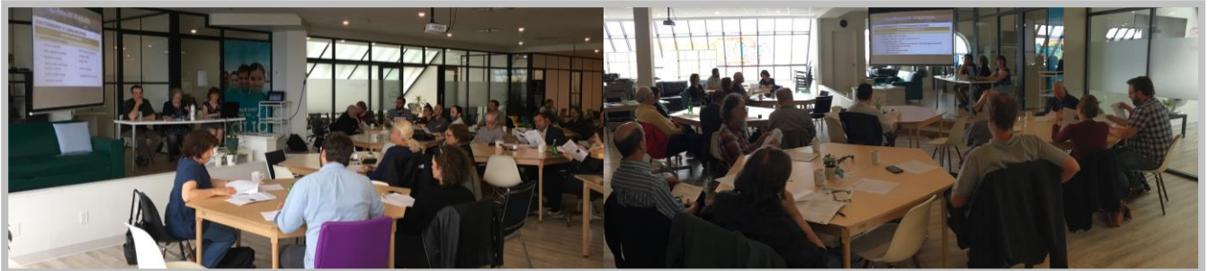
AGA du 7 juin 2018.

| Voir le Rapport d'activités 2017-2018 | | Voir le Plan d'action 2018-2019 |